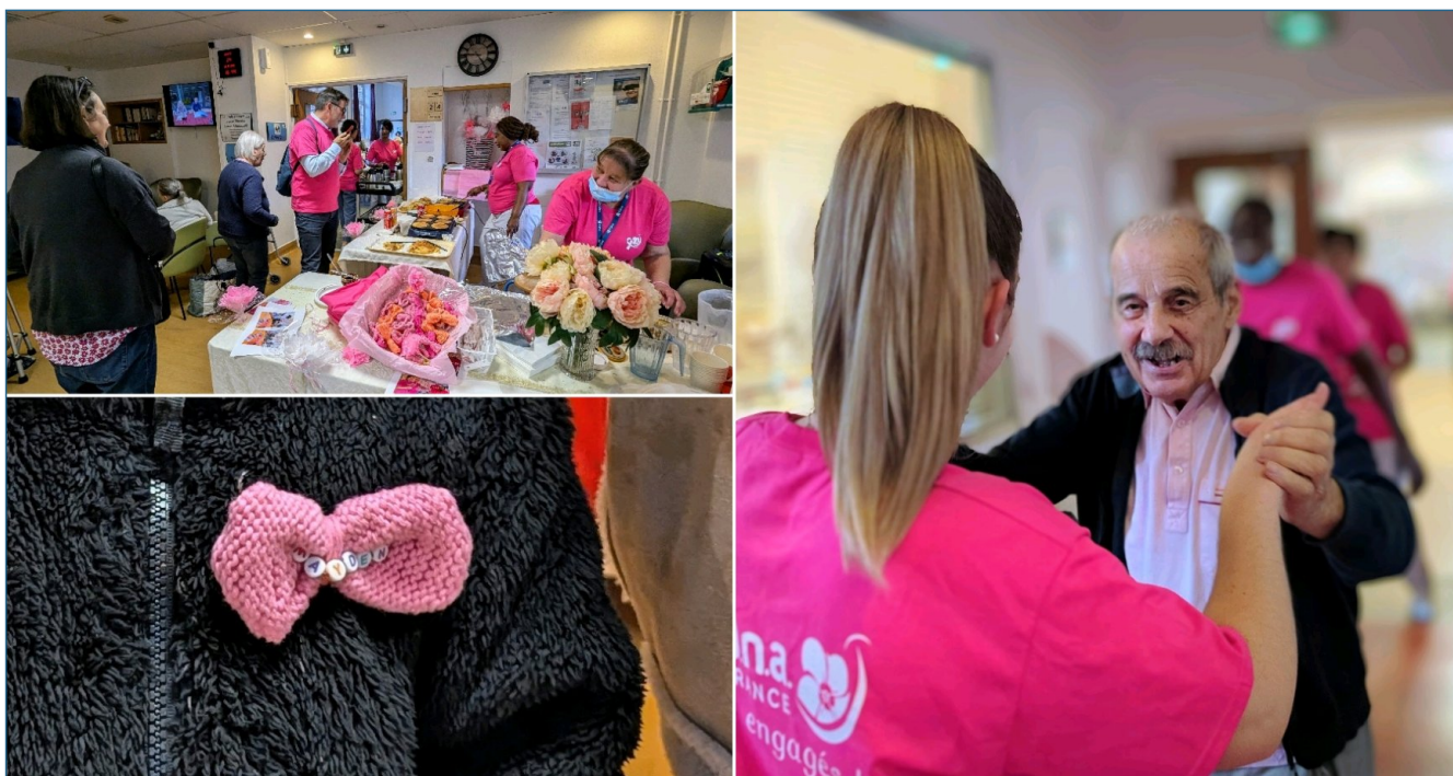
L'après-midi s'est déroulé dans une bonne ambiance !