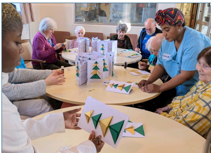
Décoration des menus pour le repas de Noël avec les familles.