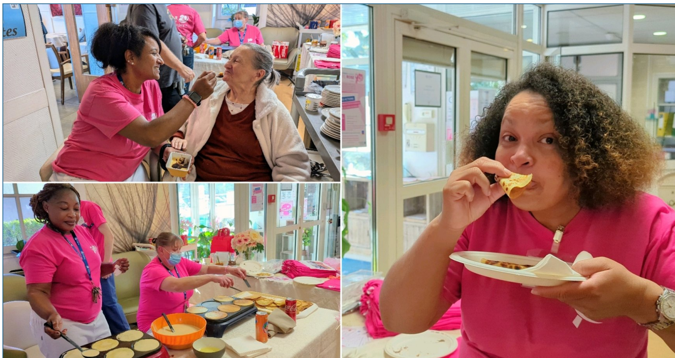
Elles étaient excellentes