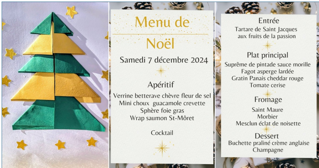
Des plats festifs au menu.