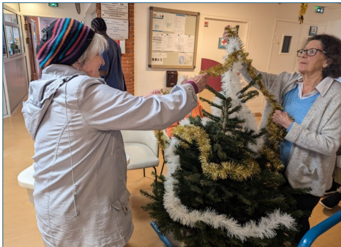
Décoration du sapin et de l'entrée de la résidence.