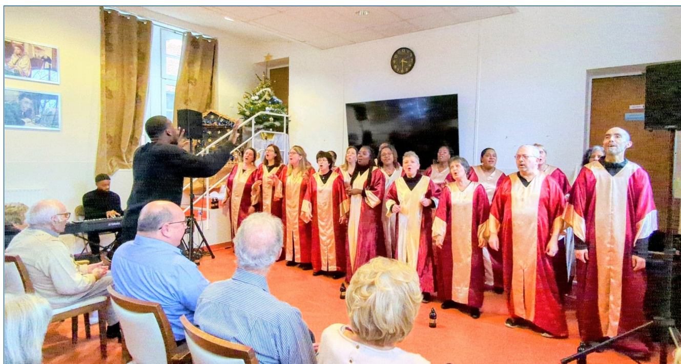
Le repas de Noël a été suivi d'un spectacle de gospel où le public était amené à participer.