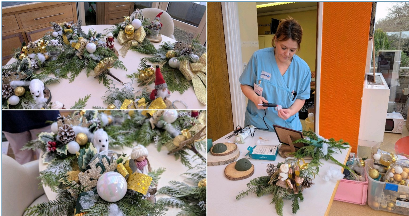
Réalisation des centres de tables par les soignantes